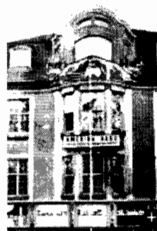
Altbau: Zwischen 1954 und 1957 ist das Amerika-Haus an der Bockenheimer Anlage untergebracht

Das ist nun vorbei. Am Donnerstag haben die Amerikaner die Schlüssel für den denkmalgeschützten Bau übergeben. Geschlossen ist das Amerika-Haus allerdings schon länger - im Prinzip seit fast fünf Jahren: seit dem 11. September 2001. Denn nach den Terror-Anschlägen an diesem Tag war auch an der Staufenstrasse nichts mehr, wie es zuvor gewesen war. Das Amerika-Haus, das bis zu diesem Tag eine offene, jedem wie auch immer Interessierten zugängliche Institution gewesen war, wurde fortan scharf bewacht. Strikte Einlaßkontrollen, Metalldetektoren, Sicherheitsbeamte - auch mit viel gutem Willen war das einstmals so lebendige Haus nicht mehr wiederzuerkennen.